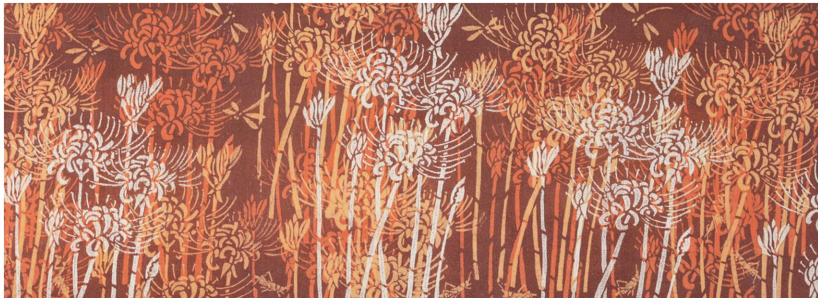
曼珠沙華燃ゆ 河村 峯子 74歳 静岡市葵区