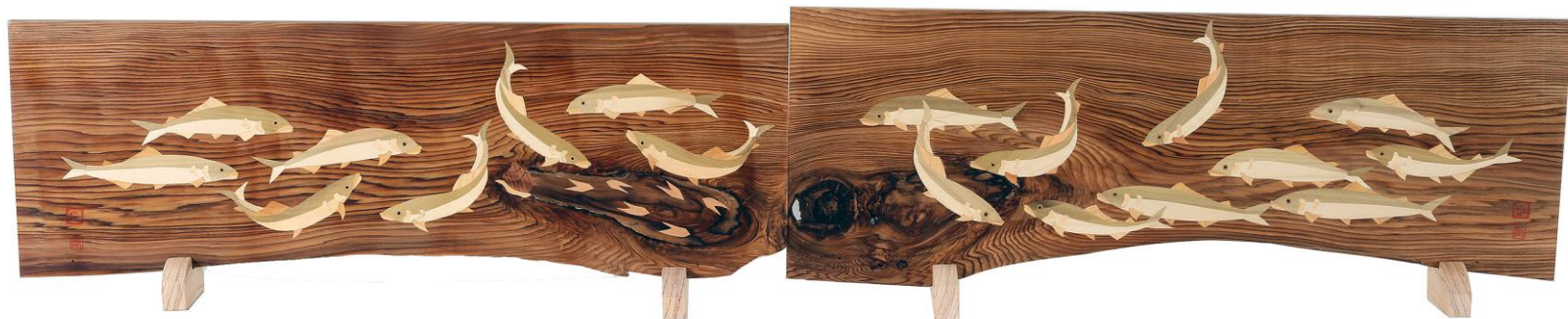
群れる 鈴木 辰哉 69歳 牧之原市