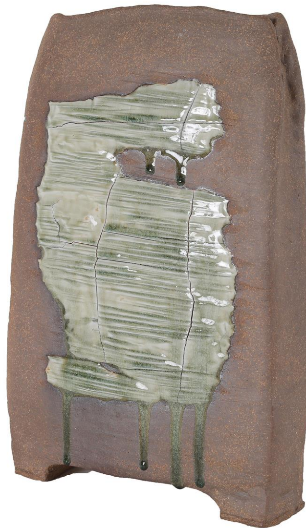
襷 上倉 和裕 81歳 静岡市葵区